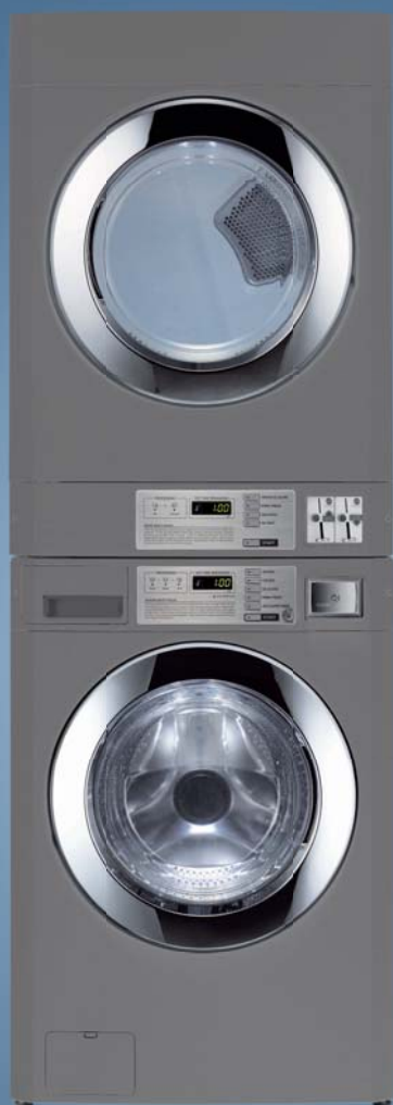
SD 205 CS